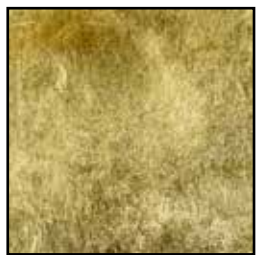
102B Foglia Oro