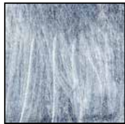
61B Foglia Argento