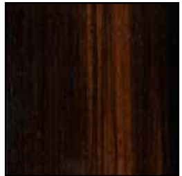
99B Ebano Amara