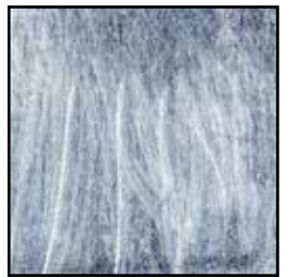
61B Foglia Argento